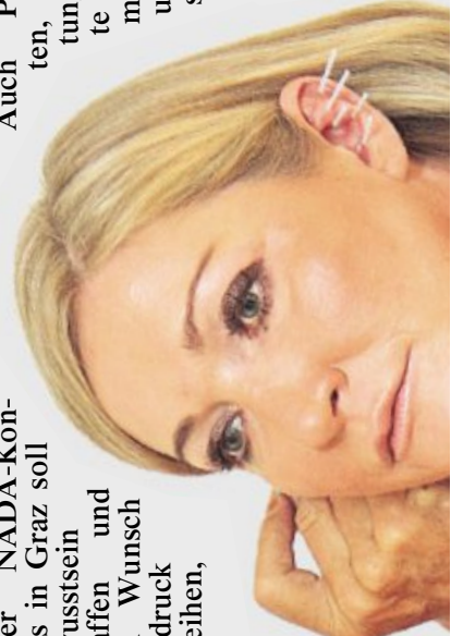
Auch bei Kinder traumatischen nissen, hier kische Flüchtlinge die Ohr-Akupunktur

nervenzertenden Spannung zu Der Kongress dre nur um die Ohren; aber per-Akupunktur sei darüber hinaus aber viele - von der Gebur bereitung bis zu Gel Dr. Ots: „Behandel man nur, was ge, nicht stört ist.“ Beispiel: B dem bräuchte er Asth völlig weg; bei Erw