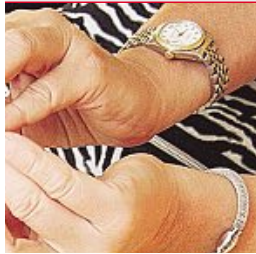
Probieren am Modell

medizinische Teilnehmer-Konkurrenz getestet: Wie sieht es denn an?